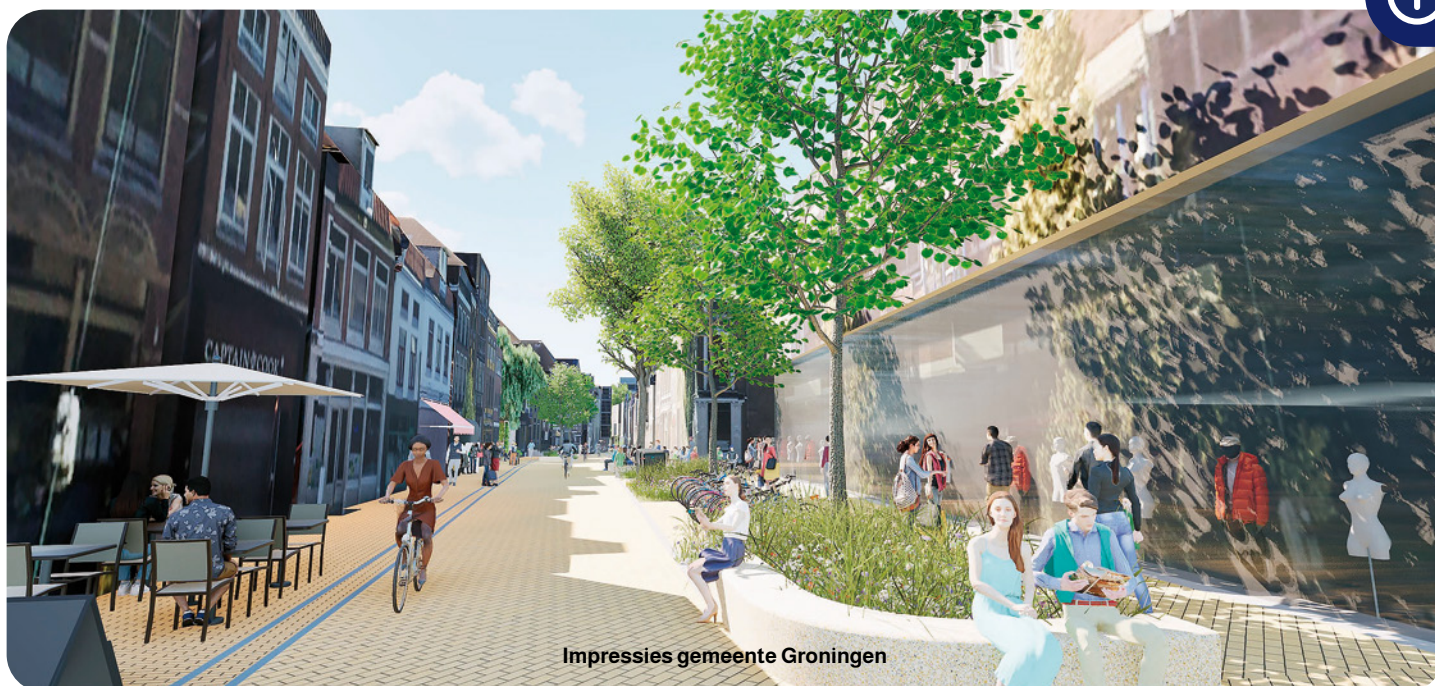
Impressies gemeente Groningen