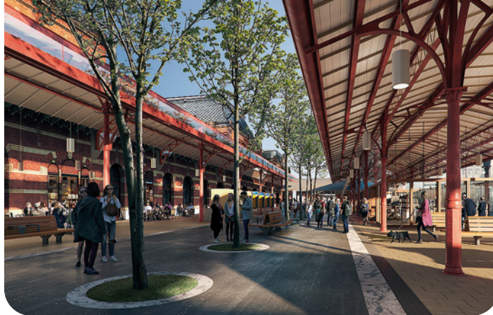
Koen van Velsen architecten

De periode met minder of geen treinen duurt 13 dagen langer dan in eerste instantie was aangekondigd. Dat heeft volgens ProRail vooral te maken met een tekort aan personeel. Vooral monteurs zijn schaars.