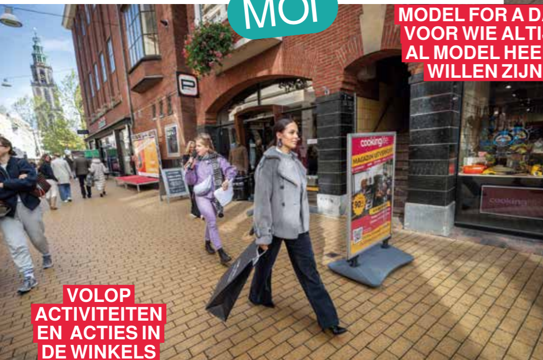
VOLOP ACTIVITEITEN EN ACTIES IN DE WINKELS