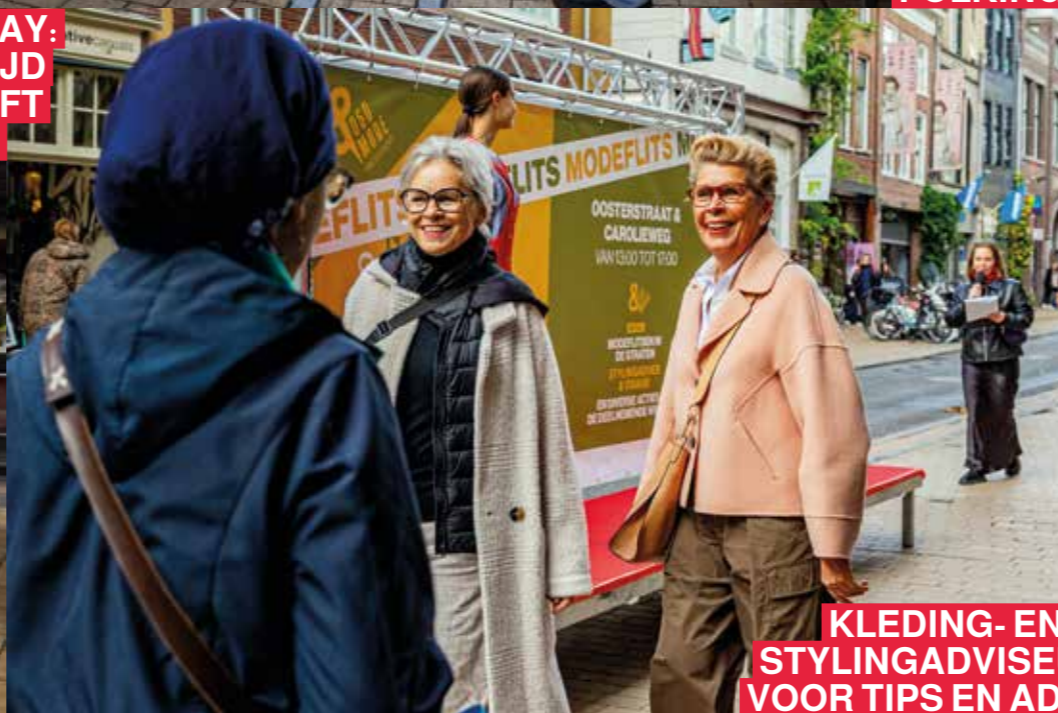
KLEDING- EN STYLINGADVISEURS VOOR TIPS EN ADVIES